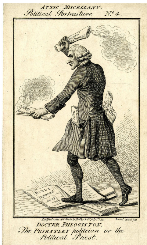
Fig. 2 - Celebre stampa satirica del 1791 nella quale si raffigura Priestley non come un naturalista ma come un prete dissidente, eversivo dell'ordine costituito, nemico del Re e della Chiesa anglicana. Priestley calpesta un trattato dal titolo Bible Explained Away . Il flogisto era anche sinonimo di principio infiammabile, ma sono i sermoni politici a fornire il combustibile per gli incendi.

Nel 1791 fu pubblicata una stampa satirica del Docter Phlogiston , ossia di Priestley che calpesta la Bibbia, ha nelle tasche dei saggi sulla materia e lo spirito, della polvere da sparo ( gunpowder ), dei brindisi rivoluzionari e brandisce un fumante sermone politico e un non meno fumante Essay on Government , ossia An Essay on the First Principles of Government , la cui prima edizione risaliva però al 1768. Nonostante il titolo, in questa immagine non c'è nessun riferimento al chimico e al filosofo naturale, è un'immagine tutta in chiave